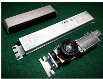
自動ドア装置「FJ3」 日本自動ドア株式会社