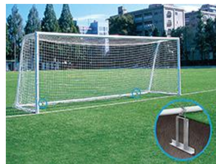
サッカーゴール転倒防止固定装置 株式会社 ルイ高