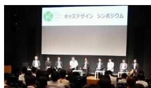
シンポジウム(イメージ)